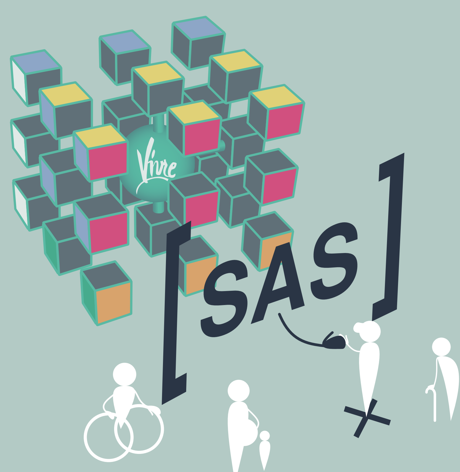
Un accueil inconditionnel

Création d'un tableau de suivi incluant les indicateurs du CPOM en lien avec l'activité SAS et des questionnaires de satisfaction des participants en vue d'une amélioration continue.