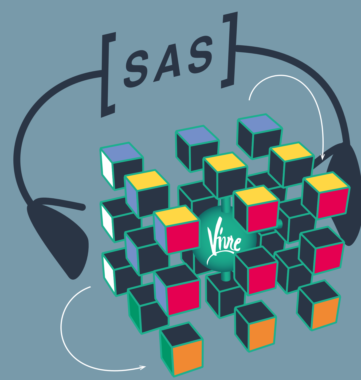
Une vision plus claire des possibilités