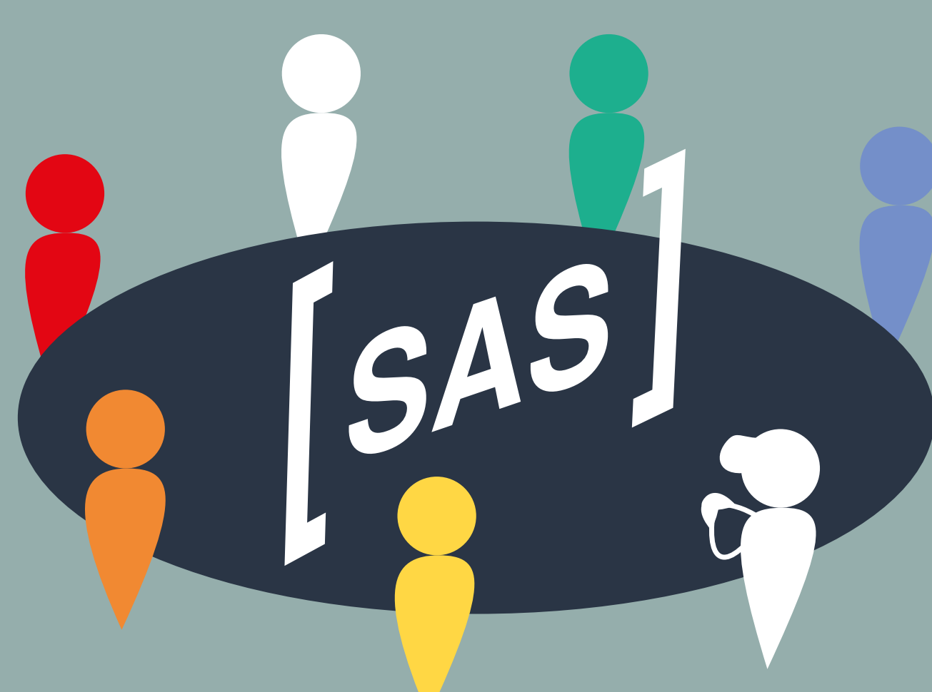
Des rencontres avec l'équipe pluridisciplinaire pour une coévaluation des besoins